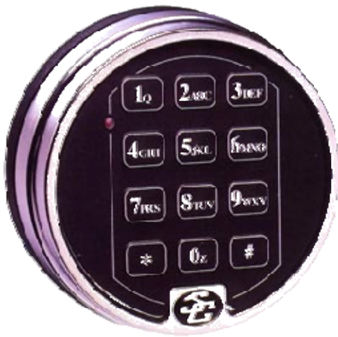
6124 & 6125