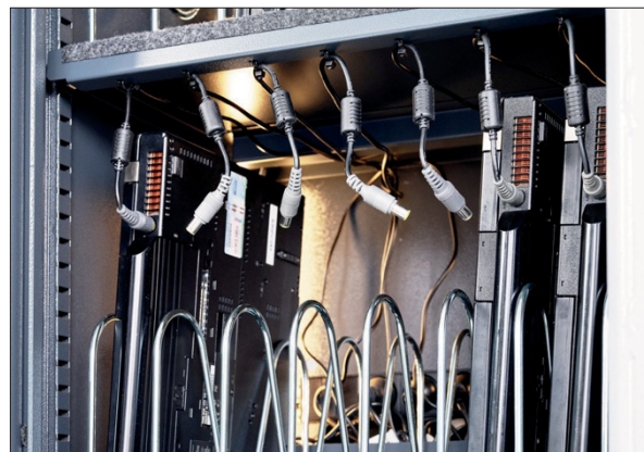
Underside af hylde med huller til strips til ledningsophæng