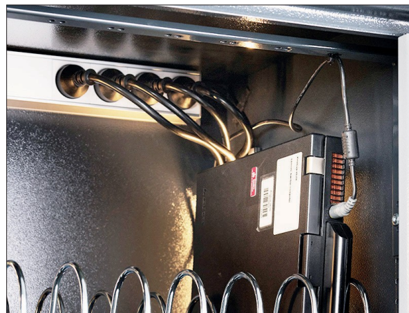
Skinne til strips til ledningsophæng